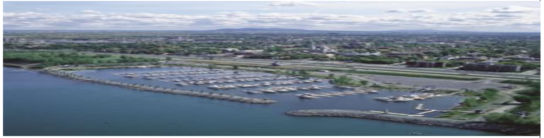
La marina de Longueuil vue du pont Jacques-Cartier. Au loin, les montérégiennes.